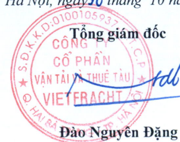
Đào Nguyên Đặng